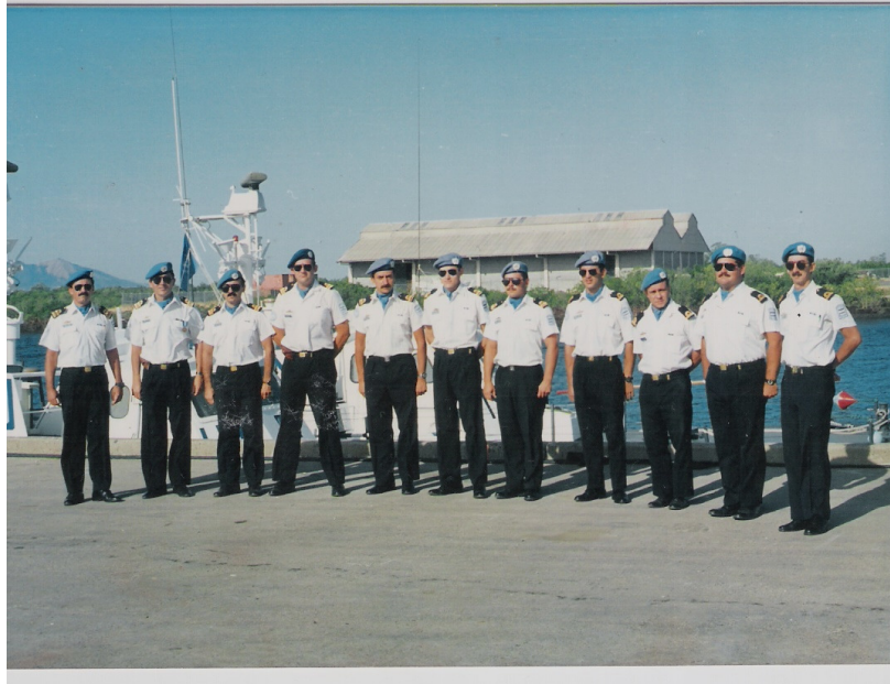
Plana Mayor del ONJUCA Naval Squadron en su cuarto y último relevo

Las cuatro embarcaciones reconocidas nacionalmente como clase Baradero, de diseño americano pero armadas en Israel, se adquirieron durante el año 1978. Son de la clase “Dabur” (“avispa” en hebreo). Compradas para equipar inicialmente el Área Naval Fluvial, recibieron nombres de ciudades litoraleñas mesopotámicas, pero fueron destacadas al sur por la eclosión del conflicto del Beagle.