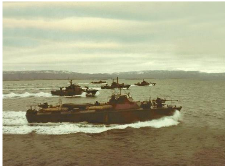
Agrupación Lanchas a fines de los años 70, en la Bahía de Ushuaia. LT Towwora adelante y las lanchas patrulleras “Baradero” en segundo plano.

Pese a su menor eslora (20 metros) y desplazamiento (35 tons.) y a disponer de una velocidad limitada (apenas superan los 20 nudos), con sólo ocho tripulantes, constituyen una fuerza de superficie nada despreciable en poder de fuego. Aunque fueron desarmadas para la misión de establecimiento de paz de América Central, al llegar al país se le instalaron dos ametralladoras de 20 mm, otras dos de 12,7 mm. y sendos lanzacohetes múltiples de diseño nacional MK 1, para proyectiles “Martín Pescador” de 70 mm. Estos últimos fueron retirados en 1985, ya obsoletos.