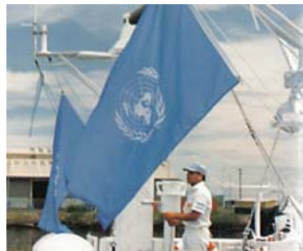
Ceremonia de Imposición de Condecoraciones (Medal Parade)