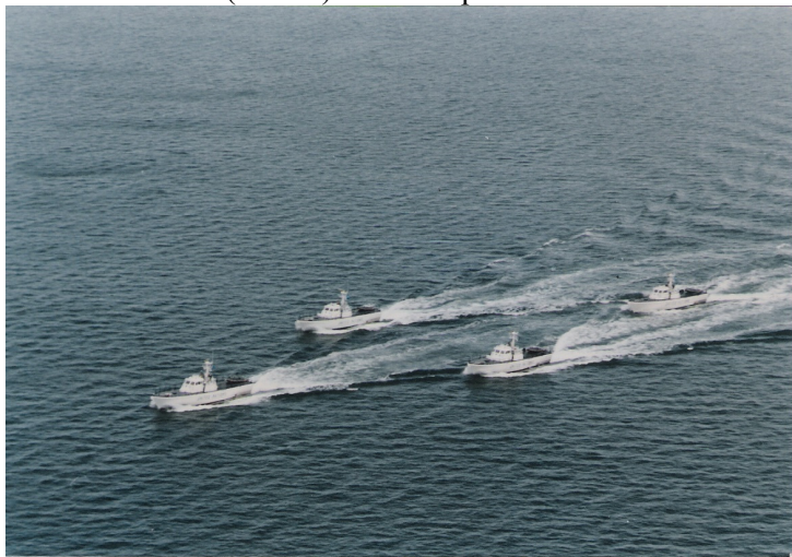
Formación “Delta” o rombo del ONUCA Naval Squadron

Esa misión fue la segunda en el historial de las Naciones Unidas que empleó una fuerza naval, luego de la operación internacional montada durante la Guerra de Corea, pero en rigor la primera bajo la conducción propia de la ONU. Por ello mismo, el Secretario General de entonces (el Sr. Butros Butros-Ghali) tenía una foto de las Lanchas Patrulleras argentinas navegando en formación “Delta” (rombo) en su despacho.