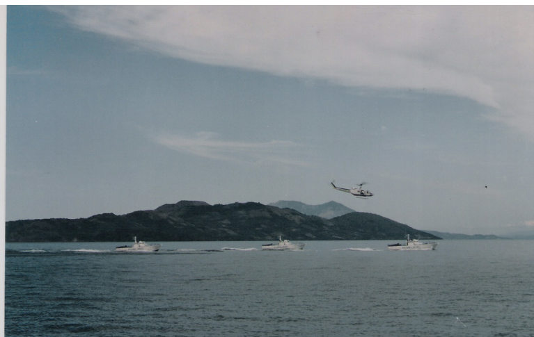
Formación en columna con un UH1H

Las acciones de bloqueo fueron complementarias, una terrestre, establecida en Honduras por el ejército de ese país con apoyo de Observadores Militares (oficiales de tierra de diferentes países como Venezuela, India, Irlanda, Canadá, etc.) y otra naval centrada en el Golfo de Fonseca, sobre el Pacífico. Esta maniobra particular fue realizada por la Armada Argentina con la División Lanchas Patrulleras apoyadas por un grupo de helicópteros (inicialmente de la Real Fuerza Aérea Canadiense y más tarde de una empresa subcontratada por la ONU -Evergreen- con pilotos mayoritariamente peruanos y chilenos).