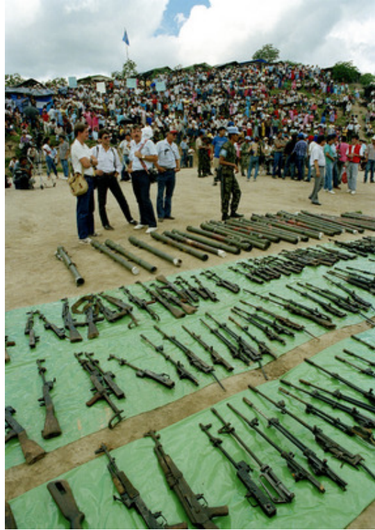
Imagen de DDR en ONUCA