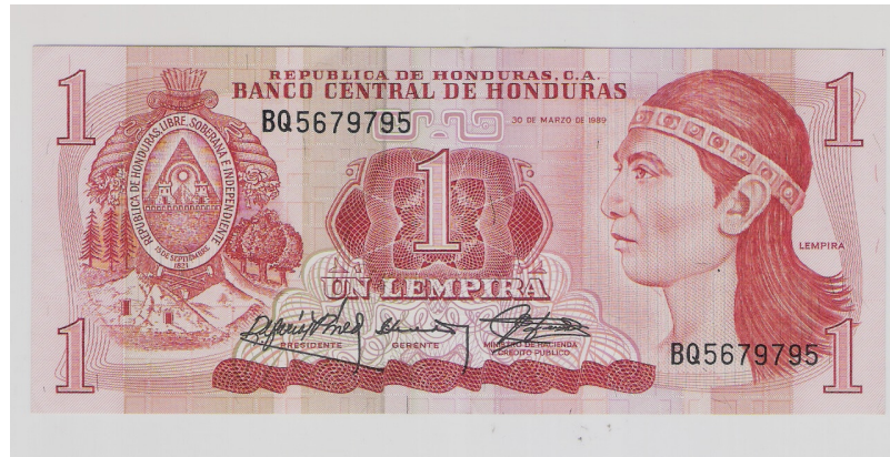
Lempira, moneda de curso legal en Honduras