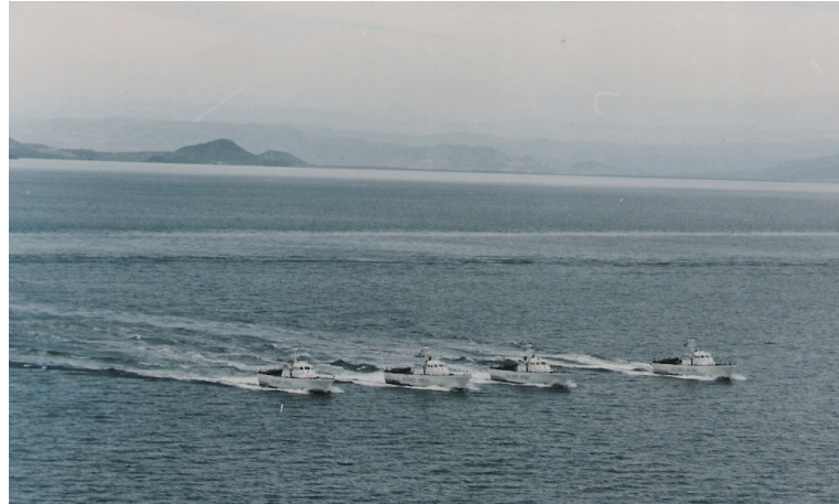
Formación en línea de frente flexible en el Golfo de Fonseca

Usualmente una lancha realizaba cada derrota, coordinando puntos de chequeo y horarios para asegurar una presencia casi continua en el área operativa. Una excepción era la visita al puerto Corinto, por la distancia y la complejidad de las relaciones con las autoridades sandinistas.